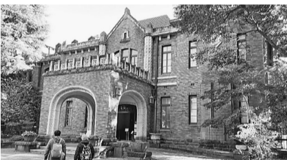
駒場公園内にある旧前田家本邸