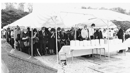
昨年の合同慰霊祭