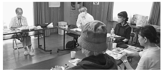
話が尽きず再開催を約束

渋谷区広尾地域は、この地域の住の友の会役員の不在のまま、久しく友の会活動ができないでいます。この地域からこころばな体操に来ている方と相談をして、まずは、「班会」というこ