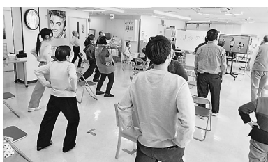
高校生2名がボランティア体験

動や代々木病院の紹介をしています。春休みに「高校生ボランティア体験」を開催しました。友の会の開催する「ごろばん体操」に2名の高校生が参加、次のような感想を寄せてくれました。「地域の人たちとどのように病院は関わり、コミュニケーションを作っているのかという事を直接見させて頂き学ぶ事が出来ました。また、ごろばん体操は転倒予防・介