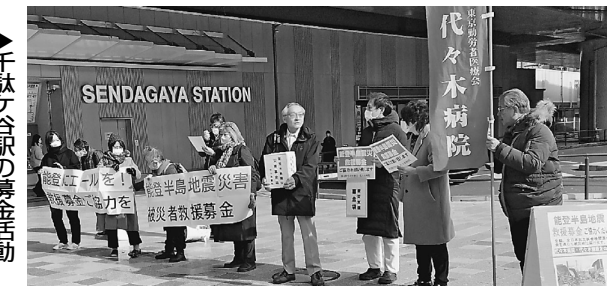
千駄ヶ谷駅の募金活動

代々木健康友の会は代々木病院と千駄ヶ谷駅頭での募金活動を1月から15回実施、17万円余の募金が寄せられました。