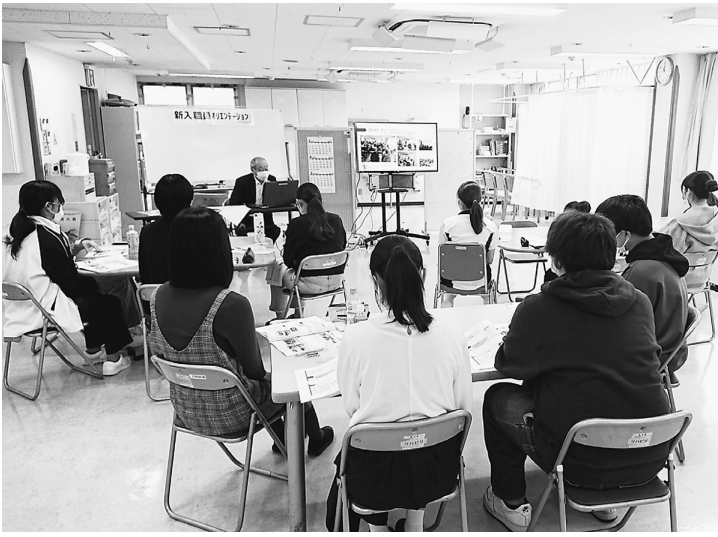
友の会の活動について説明し紹介する

友の会は、4月4日新入職員のオリエンテーションで、友の会の活動についてスライドで説明しました。友の会は病院の「あらゆる活動のパートナー」であること、地域