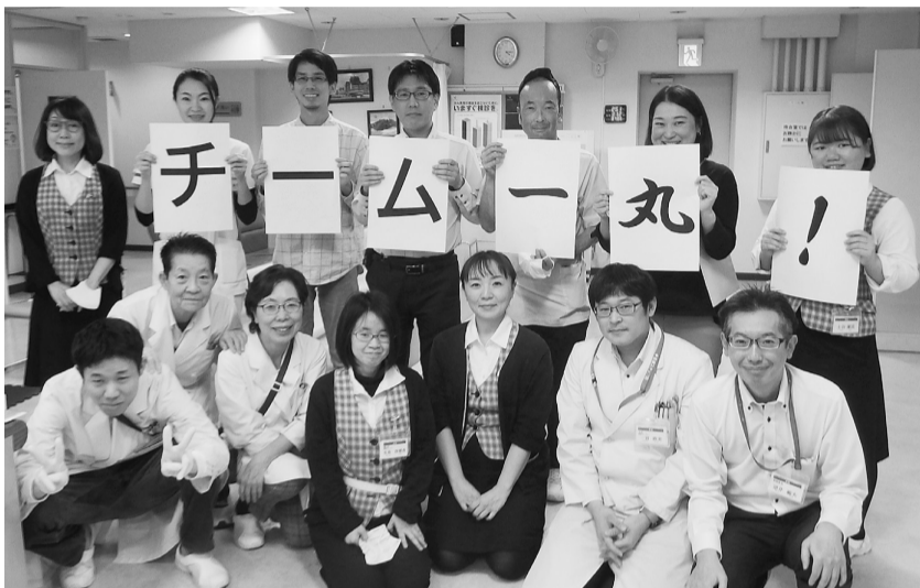
代々木病院健診課スタッフのみなさん