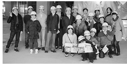
新病院の建設現場を見学した医師たち