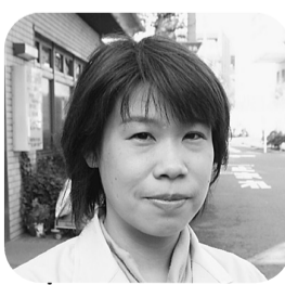
むずむず脚症候群

むずむず脚(レスト レスレッグス)症候群 という病名を聞いたこ とがありますか? じっと座っていると きや横になつている時 に、脚に不快感が起こ り、「脚を動かしたい」 「むずむずする」「虫 がはっているようだ」 「ピクピクする」「ほ てる」などの症状が現 れます。