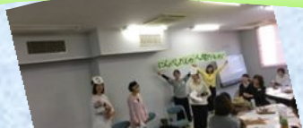
たんぼぼ訪問看護 新松戸

パワポでレクチャーや名演技を交えるなど、創意工夫の発表。小児訪問看護のシーンには赤ちゃん人形も登場です。会場は笑いと感嘆の声、拍手に包まれました ( ^ω^ )