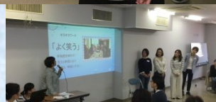
たんぼぼ訪問看護 野田